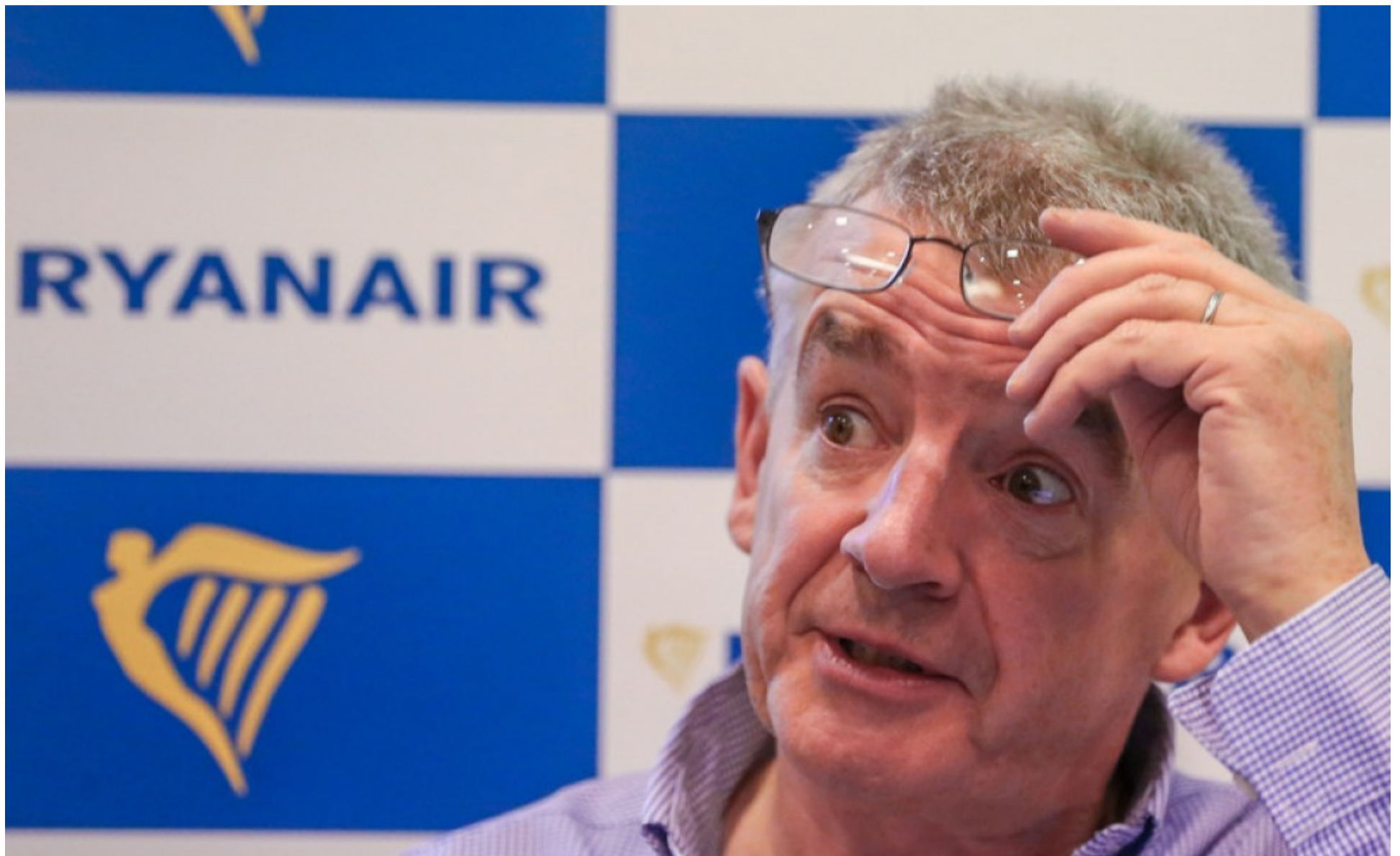
Michael O'Leary.

La Belgian Cockpit Association (BeCA) a évoqué lundi soir une menace d'un licenciement de 25% des pilotes Ryanair basés en Belgique. La crise sanitaire du coronavirus Covid-19 'ne peut en aucun cas servir de prétexte à Ryanair pour contourner la législation belge du travail', s'insurge l'organisation professionnelle représentant les pilotes de ligne en Belgique. Ceux-ci enjoignent la compagnie aérienne à bas coût de devenir 'un employeur socialement responsable'.